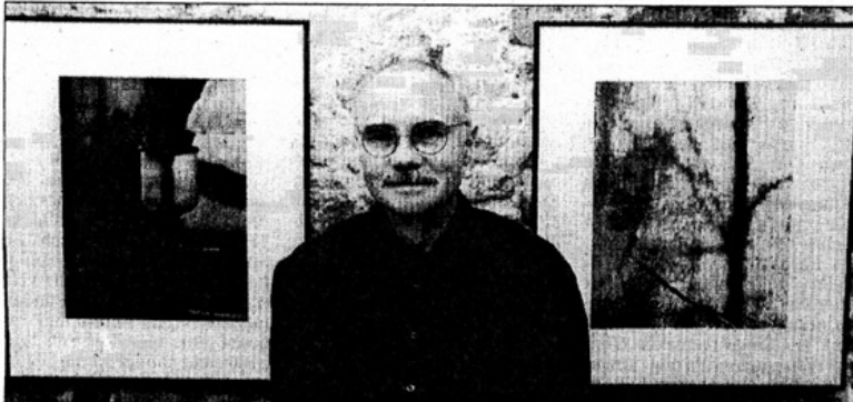
„Nature morte“ nennt Wolfgang Maus seine Ausstellung mit Bromöldrucken, die derzeit in der Niederkasseler Stadtgalerie „Alter Turm“ in Lülsdorf zu sehen ist.