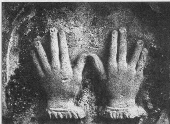
HANDZEICHEN heißt dieses Bild, im Original ein Bromöldruck. Der Ausdruck des Morbiden beschäftigte Maus über lange Zeit.